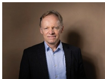
Prof. Dr. Dr. h.c. Clemens Fuest

Sprecher des Kronberger Kreises, Direktor des Walter Eucken Instituts, Universität Freiburg, ehem. Vorsitzender des Sachverständigenrats zur Begutachtung der gesamtwirtschaftlichen Entwicklung.