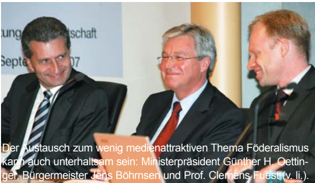
Der Austausch zum wenig medienattraktiven Thema Föderalismus kann auch unterhaltsam sein: Ministerpräsident Günther H. Oettinger, Bürgermeister Jens Böhrnsen und Prof. Clemens Fuest (v. li.).

MELH-3.101 steht für einen der spektakulärsten Räume im Deutschen Bundestag. Trotz des eindrucksvollen Blicks auf die Spree und das Reichstagsgebäude herrschte jedoch eine konzentrierte Stimmung während der Veranstaltung zur „Föderalismusreform II“, zu der die Stiftung Marktwirtschaft mit Unterstützung des Landes Baden-Württemberg im September eingeladen hatte. Es entwickelte sich ein leb-