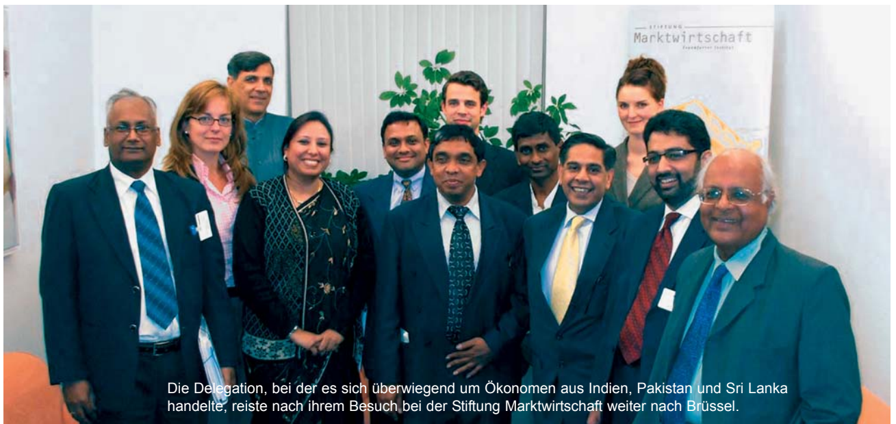
Die Delegation, bei der es sich überwiegend um Ökonomen aus Indien, Pakistan und Sri Lanka handelte, reiste nach ihrem Besuch bei der Stiftung Marktwirtschaft weiter nach Brüssel.

Auf der Suche nach einer liberalen Strategie im Rahmen der Entwicklungspolitik sind Wirtschaftsexperten aus Südostasien auf Einladung der Friedrich-Naumann-Stiftung für die Freiheit bei der Stiftung Marktwirtschaft zu Gast gewesen. Sie wollten mehr über die German „Soziale Marktwirtschaft“ in Erfahrung bringen und fragten nach der Beurteilung der deutschen Wirtschaftspolitik durch den Think-Tank. Die Einbeziehung ihrer Region in nationale Überlegungen maßen sie dabei einen hohen Stellenwert bei. In einem kurzweiligen Austausch stellten beide Seiten fest, dass sich manche Probleme im Bereich der Bürokratie und Besitzstandswahrung trotz der großen Entfernung und kulturellen Unterschiede doch stark ähneln.