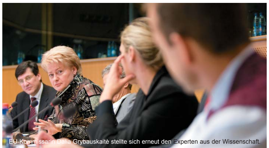
EU-Kommissarin Dalia Grybauskaitė stellte sich erneut den Experten aus der Wissenschaft.