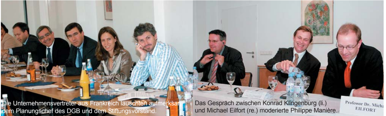
Die Unternehmensvertreter aus Frankreich lauschten aufmerksam dem Planungschef des DGB und dem Stiftungsvorstand.