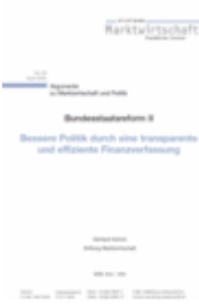
Argumente zu Marktwirtschaft und Politik Heft Nr. 83