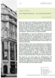
Positionspapiere Heft Nr. 8