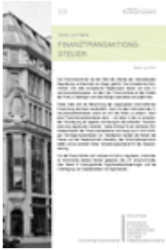
Positionspapiere Heft Nr. 3