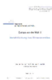
Argumente zu Marktwirtschaft und Politik Heft Nr. 84