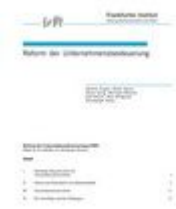
Kronberger Kreis- Studien Heft Nr. 18