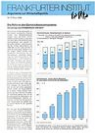
Argumente zu Marktwirtschaft und Politik Heft Nr. 17