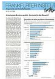
Argumente zu Marktwirtschaft und Politik Heft Nr. 19