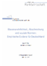
Argumente zu Marktwirtschaft und Politik Heft Nr. 112