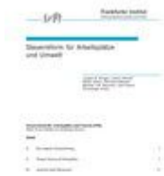
Kronberger Kreis- Studien Heft Nr. 30