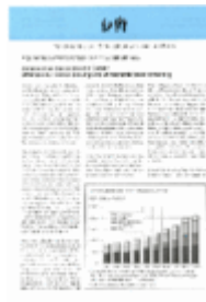
Argumente zu Marktwirtschaft und Politik Heft Nr. 53