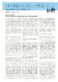
Argumente zu Marktwirtschaft und Politik Heft Nr. 50

Stiftung Marktwirtschaft Bad Homburg, 1995