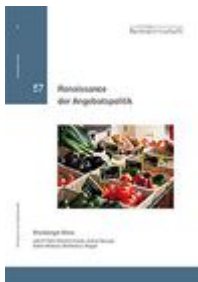
Kronberger Kreis- Studien Heft Nr. 57