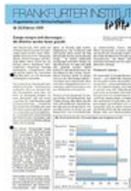
Argumente zu Marktwirtschaft und Politik Heft Nr. 23