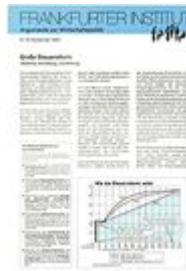
Argumente zu Marktwirtschaft und Politik Heft Nr. 15