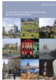
Argumente zu Marktwirtschaft und Politik Heft Nr. 126