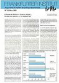
Argumente zu Marktwirtschaft und Politik Heft Nr. 23