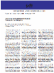
Argumente zu Marktwirtschaft und Politik Heft Nr. 54