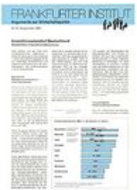
Argumente zu Marktwirtschaft und Politik Heft Nr. 14