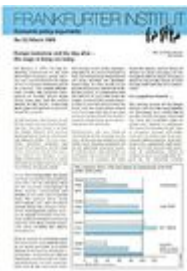
Argumente zu Marktwirtschaft und Politik Heft Nr. 23