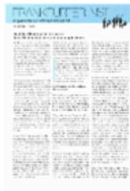
Argumente zu Marktwirtschaft und Politik Heft Nr. 51