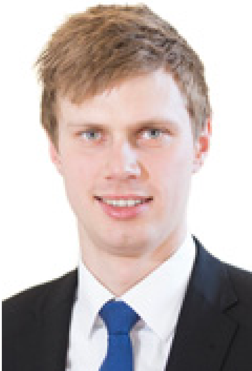
Wissenschaftlicher Mitarbeiter, Leiter Digitale Transformation