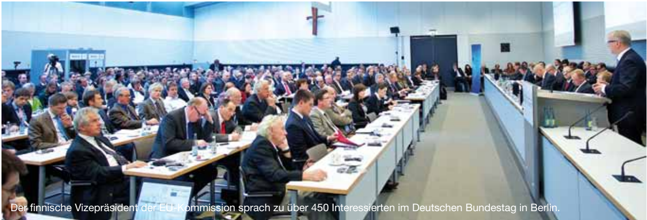
Der finnische Vizepräsident der EU-Kommission sprach zu über 450 Interessierten im Deutschen Bundestag in Berlin.

Der Vizepräsident und Kommissar für Wirtschaft, Währung und Euro zu Gast in Berlin