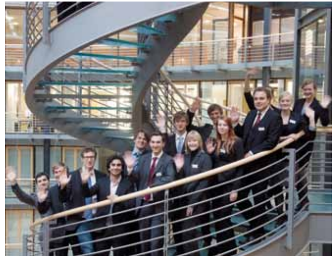
Ideen ohne Grenzen – der Wettbewerb

GENERATION-D IDEEEN FÜR DEUTSCHLAND. GEMEINSAM ANPACKEN.