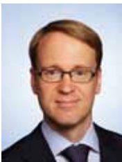
Good Bank Jens Weidmann

Noch sind es Absichtserklärungen ohne Verbindlichkeit, noch ist es nur eine Atempause, noch müssen viele EU-Mitglieder auch atmosphärisch wiedergewonnen werden. Aber seit dem letzten Brüsseler Gipfel stimmen die Absichten – und sind richtige Einsichten erfolgt. Ja zu weitergehender Integration, ja zu Schuldenbremsen, nein zu Eurobonds, solange sie nur nationalen Leichtsinns verlängern und solide Staaten bestrafen. Nein zu (noch mehr) Gelddrucken durch die EZB. Dazu endlich Automatismen nach Regelverstößen, damit nicht mehr Sünder über Sünder befinden. Angela Merkel hat mit Geduld, Geschick, Zähigkeit und am Ende auch mit Nicolas Sarkozy fast alle EU-Länder überzeugt und Gutes erreicht. Ohne ihr Zögern im Frühjahr 2010 wäre in Griechenland überhaupt nichts passiert, ohne ihre klare Haltung jetzt der teure Aktionismus mit dem Blick nur für die jeweils nächsten fünf Minuten weitergegangen. Auf neudeutsch: Eine echte „High Performance“!