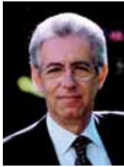
Super Mario Mario Monti

Italien kommt: Mit Mario Monti hat das Land wieder einen soliden Regierungschef und Italien die Anerkennung bei seinen Nachbarn und hoffentlich auch bald wieder bei den Investoren, die es auf bedauerliche – wenn auch unterhaltsame – Weise in den vergangenen Jahren hat entbehren müssen. Vor zehn Jahren wurde Monti von der Stiftung Marktwirtschaft mit dem Wolfram-Engels-Preis ausgezeichnet. Sein Engagement galt bereits damals, als Wettbewerbskommissar, der europäischen Integration, insbesondere aber dem Schutz des Wettbewerbs auf dem Binnenmarkt sowohl vor staatlichen Interventionen als auch vor Subventionen. Italien schneidet beim Nachhaltigkeitsranking der Stiftung Marktwirtschaft aktuell am besten ab. Dass es diese Chance nutzt, ist ihm zu wünschen: Congratulazioni Presidente!